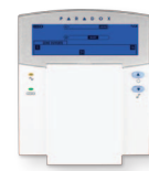
Clavier ACL fixe sans fil/câblé pour 32 zones K37/K35