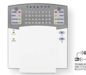
Clavier à DEL sans fil/câblé pour 32 zones K32RF/K32