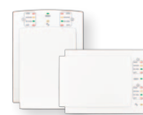
Clavier à DEL câblé pour 10 zones K10H/V